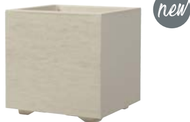
Cubo GRAVITY Mastic à réserve d'eau