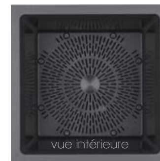
Cubo GRAVITY Carbone à réserve d'eau