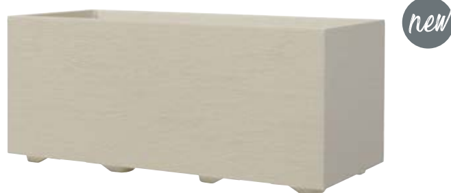
Muret GRAVITY Mastic à réserve d'eau