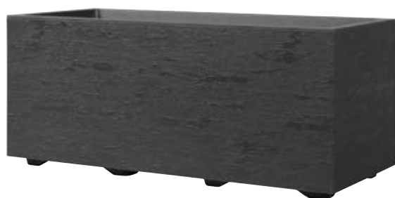
Muret GRAVITY Carbone à réserve d'eau