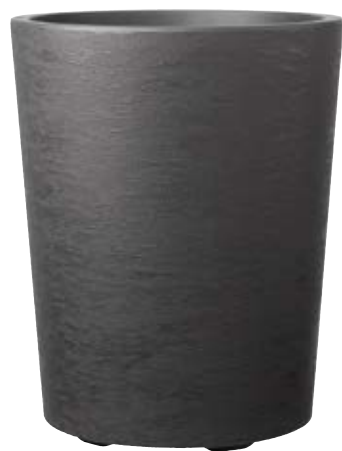
Vaso GRAVITY Carbone à réserve d'eau