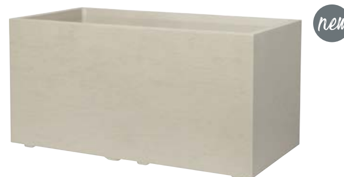
Muret GRAVITY Mastic à réserve d'eau