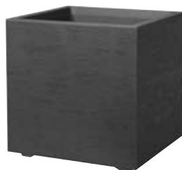
Cubo GRAVITY Carbone à réserve d'eau