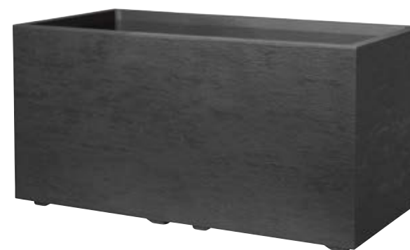
Muret GRAVITY Carbone à réserve d'eau