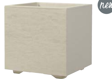
Cubo GRAVITY Mastic à réserve d'eau